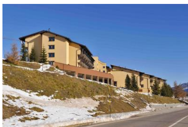
Apartamenty Tonale3 Położony 150m od stoku.